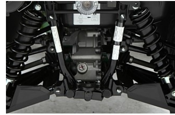
Irs och pphängning med dubbla triangellänkar