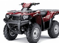
Dark Royal Red

Rekommenderat cirkapris inklusive 25 procents moms. Priserna kan ändras utan avisering.