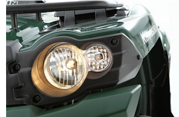
Ny design på stötfångaren